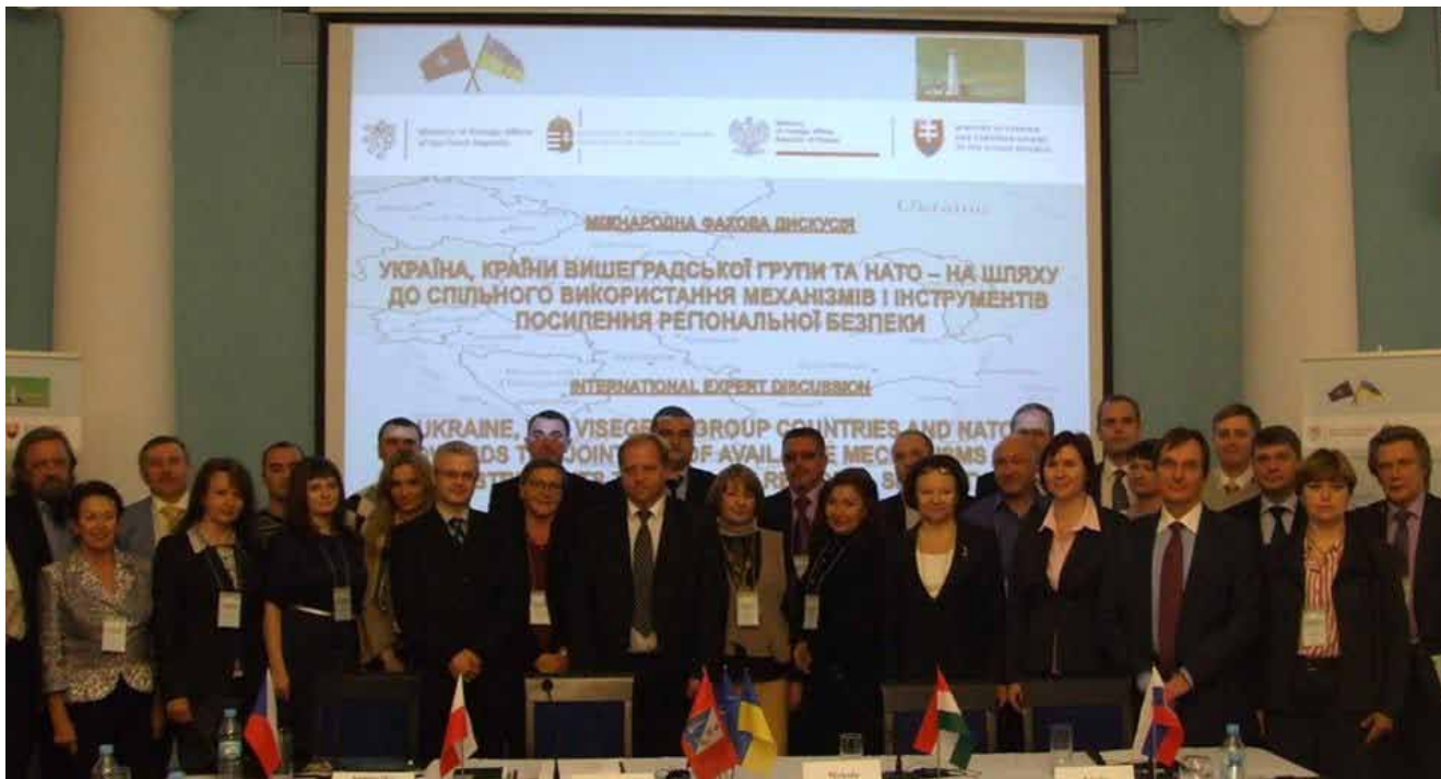
Севастополь, 6 листопада 2013 року.

глих столів та семінарів, таких як «Севастопольський форум – 2006», «Консорціум демократичного контролю», Форуму «Україна – НАТО» (Вроцлав, 2007 р.), Форуму «Україна – Європа» (Польща), низки зустрічей Кримського політичного діалогу, щорічної конференції «Енергетична безпека Центральної Європи та ЄС» (Братислава), щорічного Міжнародного економічного форуму в Криниць (Польща), енергетичних та газових форумів в форматі Вишеградської групи та Центральної Європи.